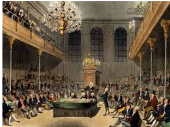
Tras la Revolución de la Gloriosa el sistema parlamentario inglés quedó dividido en dos cámaras de los lores y de los comunes

El nuevo rey aceptó la Declaración de Derechos (Bill of Rights), 1689, un documento que recortaba sus poderes, garantizaba las elecciones libres y otorgaba amplios poderes al Parlamento. De esta forma, Inglaterra se convierte en el primer Estado con un monarquía de poder limitado, ya que el monarca está condicionado por el parlamento y el rey sólo puede elegir al Primer Ministro de entre los parlamentarios que han sido elegidos. Se separan los poderes en ejecutivo, legislativo y judicial y se otorgan derechos individuales a los ciudadanos. Esta monarquía fue un ejemplo de inspiración para los pensadores ilustrados franceses, que fueron el germen ideológico de los principios de la Revolución Francesa de 1789 (siglo XVIII).